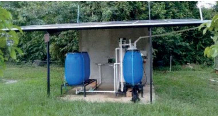
Unit C1, with photovoltaic panels, COLOMBIA Unité C1, avec panneaux photovoltaïques, COLOMBIE

Des solution adaptées pour Eaux & Assainissement et AEP (Adduction Eaux Potables).