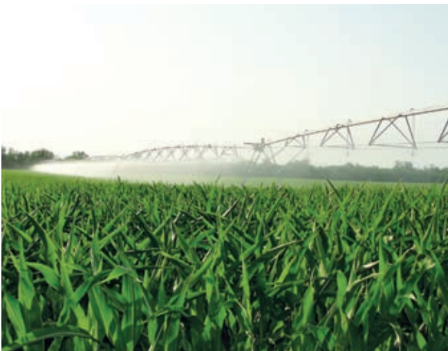
Centre pivot and lateral move irrigation system Irrigation par rampes et pivots

Grâce à sa compétence, l'évolution et l'optimisation de ces techniques répondent aux besoins croissants de productivité et de rentabilité de ses clients.