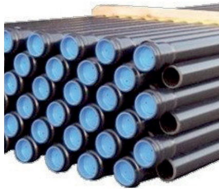
Bundle of PVC pipes - European standard Fardeaux de tubes PVC Normes Européennes