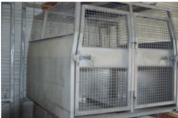
Specific stainless steel construction Construction spécifique inox 316 et 304