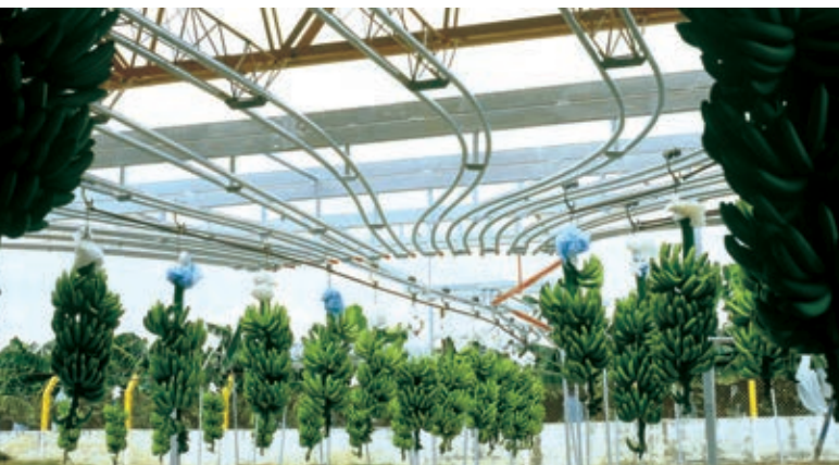
Fruits' park Parking des fruits