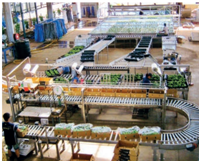
Packing plants for bananas Station de conditionnement pour bananes