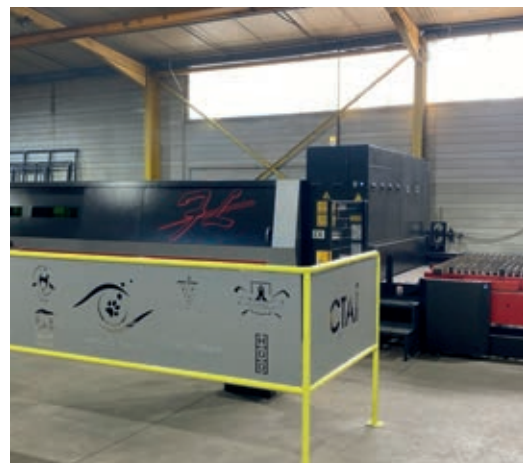
Digital laser cutting table Table de découpe numérique laser