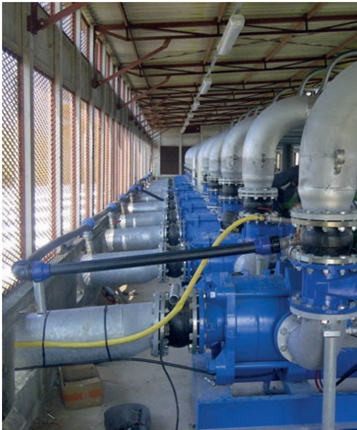
Pump sets for frost fighting application Station de pompage destinée à la lutte contre le gel