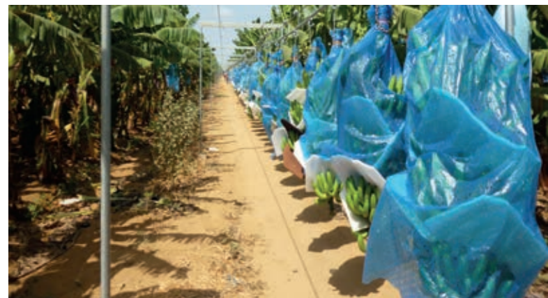
Supplying a packing plant by cableway Alimentation d'une station de conditionnement par cableway