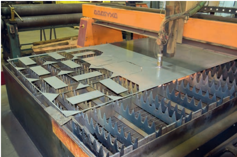
Plasma numerical cutting table Table de découpe numérique plasma