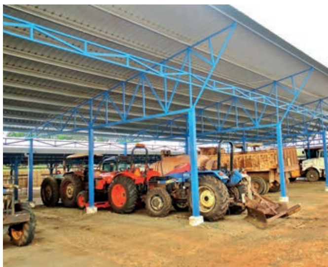
Agricultural and industrial building design Conception de bâtiments agricoles & industriels