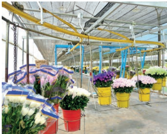
Packing plants for flowers Station de conditionnement pour fleurs