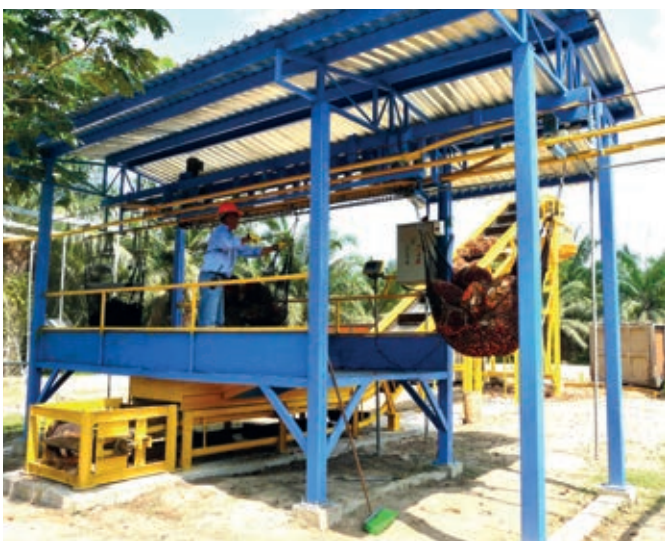
Conveying of oil palm bunches Acheminement de régimes de palmiers à l'huile