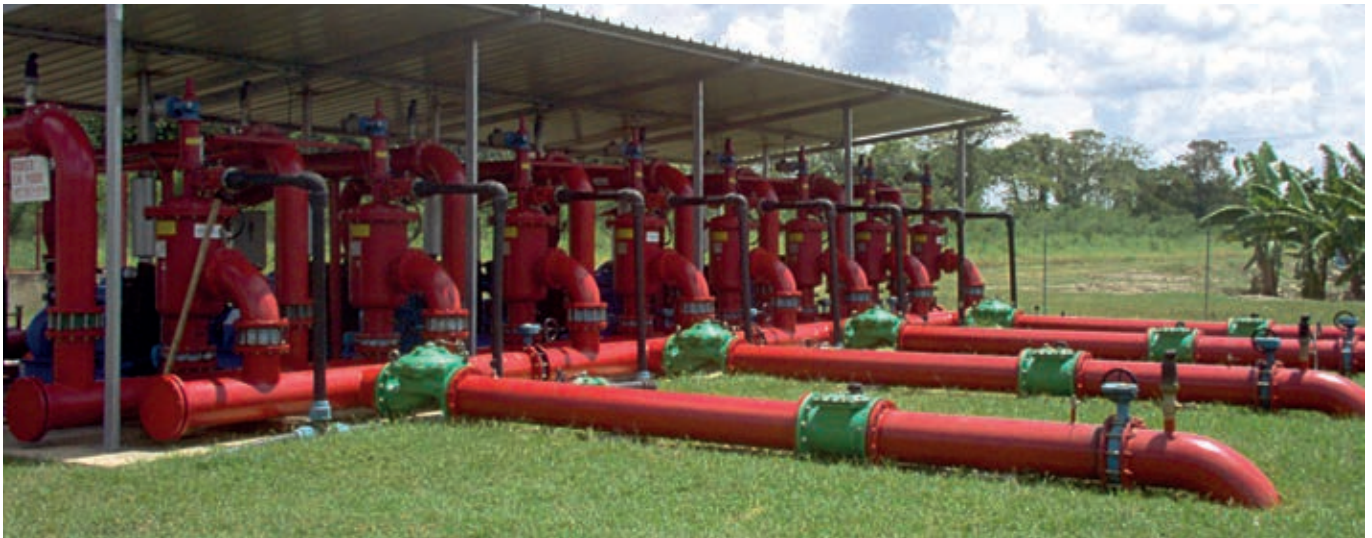
Pumping station delivering high flow rate with heat engine Station de pompage gros débit avec moteur thermique

With over 20 years of experience in the field of irrigation, the 2 GAPE's team strives to develop highly innovative and performing irrigation techniques and water management.