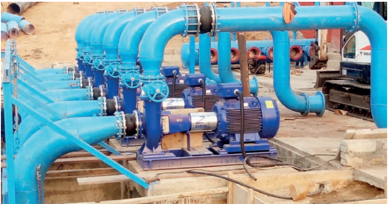
Pumping station with electric pumps being installed Station de pompage avec électropompes en cours de montage

Nos unités de potabilisation portatives sont une solution clé en main, rapide à mettre en œuvre. Elles permettent de traiter et potabiliser les eaux de surface polluées, les eaux saumâtres et de mer . L'eau peut être puisée dans différentes sources et transformée en eau filtrée, essentielle à notre consommation quotidienne.