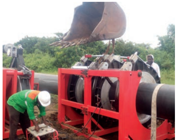
Polyethylene pipe butt welding Soudage bout à bout de tuyaux en PE