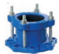
High tolerance flange adaptor Adaptateur à brides grande tolérance