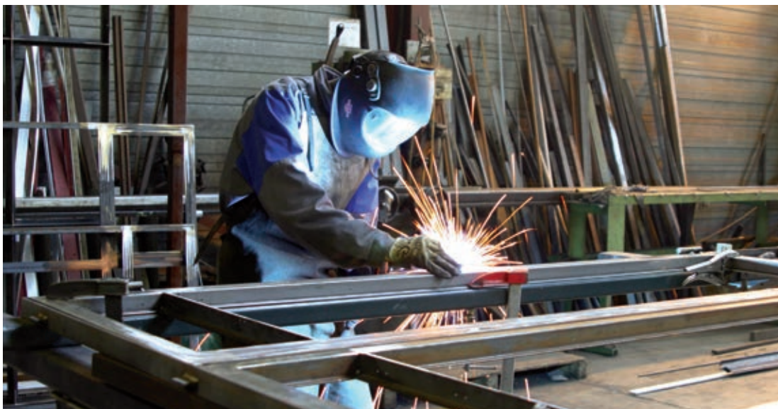
Conventional stem welding Soudure TIG/MIG conventionnelle

Sa production est ainsi adaptée à tous les besoins , quel que soit le secteur d'activité.