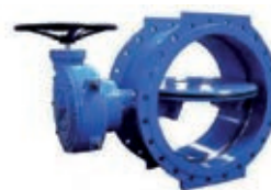
Double-excentration butterfly valve Vanne papillon à double excentration

Applications : adduction d'eau potable, irrigation, assainissement, pétrole, incendie, barrages, aménagements hydro-agricoles