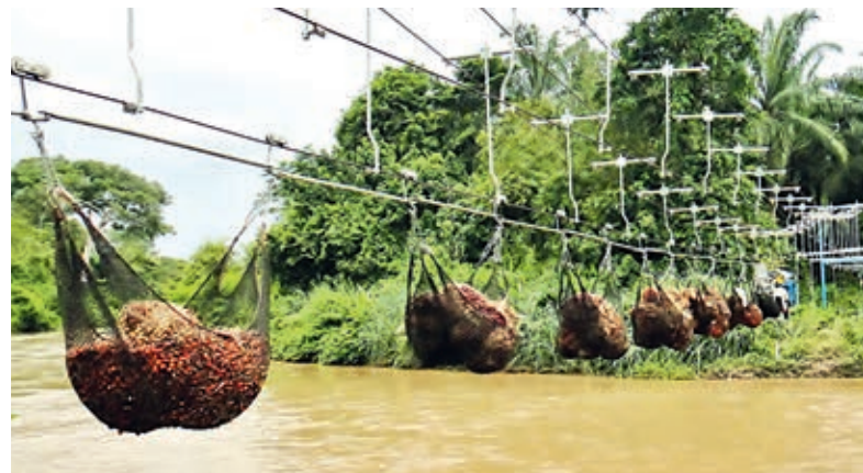
Cableway Transport par câbles