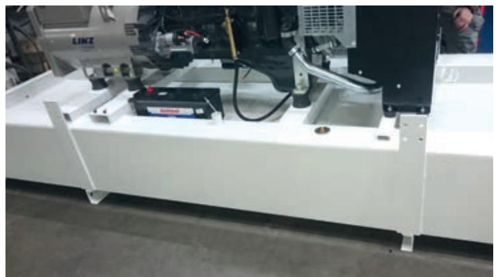
Specific frame Chassis spécifique