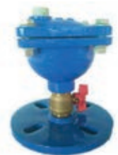
Eco automatic suction cup Ventouse automatique Eco