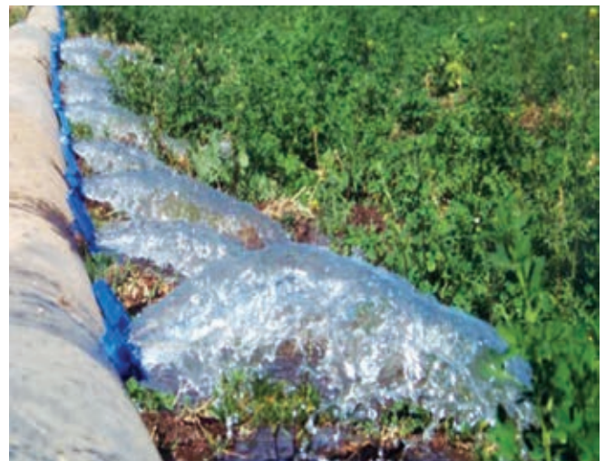
Gravity-fed pipe water system Gaines souples pour amenée et refoulement d'eau gravitaire