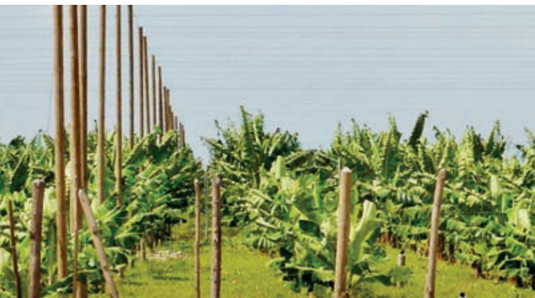
Overhead cable propping Haubanage

Centro Aceros a été créée en 1987. La division "Transport par câbles" est apparue en 1990 comme une évidence suite aux développements importants des plantations de bananes en Colombie. En 1994, elle intègre la division « Haubanage ». Au début des divisions « Transport par câbles » et « Haubanage », Centro Aceros a constaté un réel besoin d'ingénierie et de fabrication. La société a donc commencé à concevoir des bâtiments pour l'agro-industrie et des unités de conditionnement pour garantir une qualité optimale des bananes, fleurs et huile de palme. Centro Aceros travaille en collaboration avec les producteurs afin de comprendre leurs besoins et d'apporter des solutions.