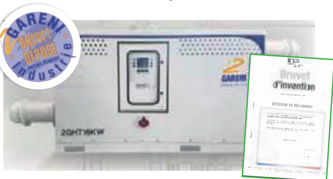
N° and date of publication : FR3061408 - 2018-07-06 N° et date de publication : FR3061408 - 2018-07-06

Alimenté par une source hydraulique et entièrement automatique.