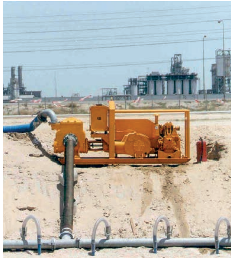
Well point dewatering Rabattement de nappes par pointes filtrantes