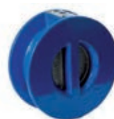
Double flapper valve PN10-PN16 Clapet à double battant PN10-PN16