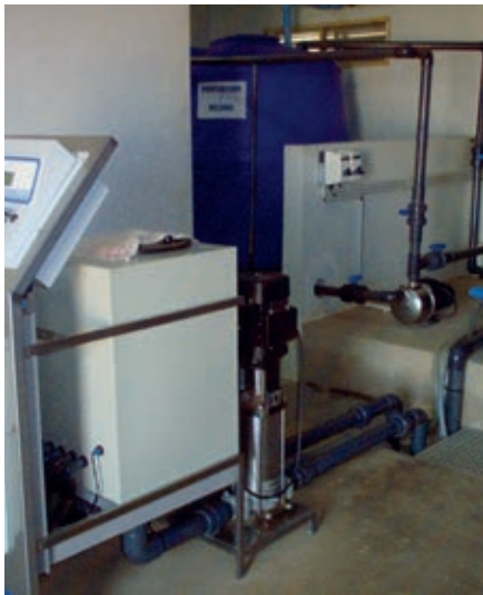
Fertiliser injection computer Ordinateur pour injection d'engrais