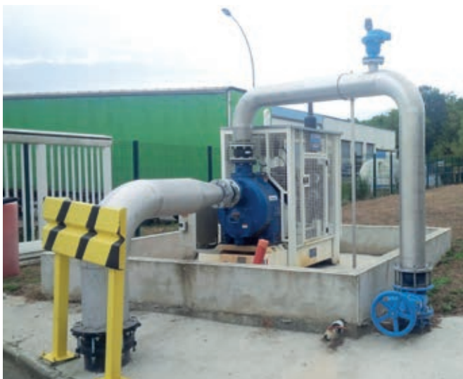
Motor-driven pump for the pumping of leachate 400 m3h Motopompe pour pompage de lixivie d'incendie 400 m3h