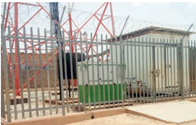
Emergency generating set on telecommunication tower Groupe électrogène secours sur pylône téléphonique